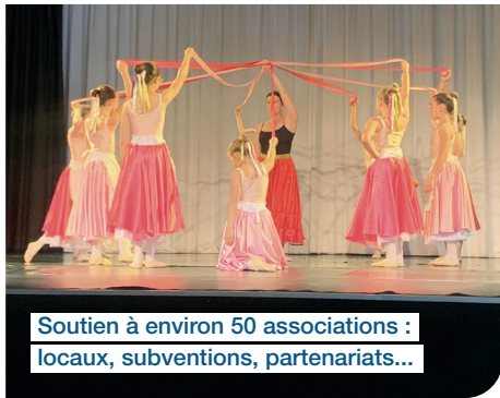
Soutien à environ 50 associations : locaux, subventions, partenariats...