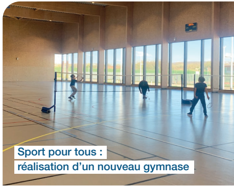
Sport pour tous : réalisation d'un nouveau gymnase