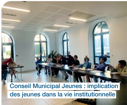
Conseil Municipal Jeunes : implication des jeunes dans la vie institutionnelle