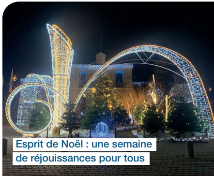
Esprit de Noël : une semaine de réjouissances pour tous