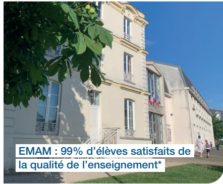
EMAM : 99% d'élèves satisfaits de la qualité de l'enseignement*