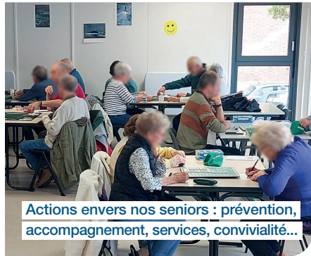
Actions envers nos seniors : prévention, accompagnement, services, convivialité...