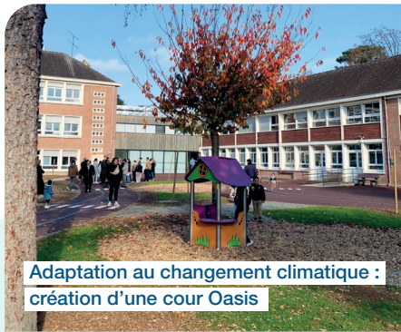
Adaptation au changement climatique : création d'une cour Oasis