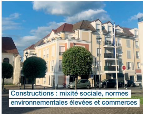
Constructions : mixité sociale, normes environnementales élevées et commerces