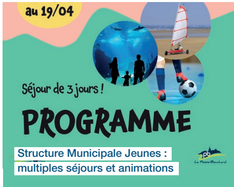
Structure Municipale Jeunes : multiples séjours et animations