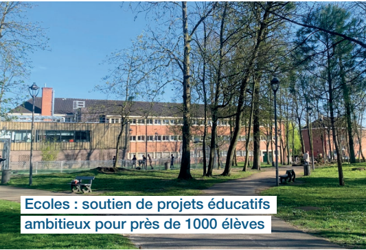
Ecoles : soutien de projets éducatifs ambitieux pour près de 1000 élèves