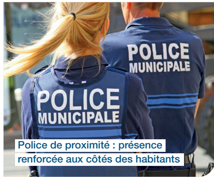
Police de proximité : présence renforcée aux côtés des habitants

* : enquête 2025 auprès des usagers de l'école municipale de musique et des arts plastiques (111 réponses)